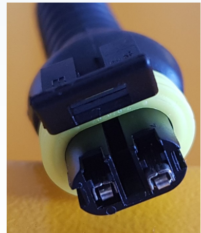
Figura 4 ELECAV121719000